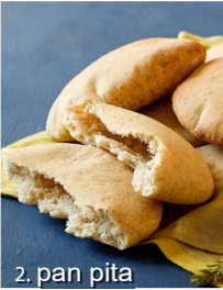
2. pan pita