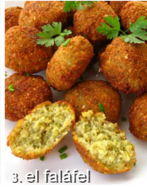
3. el faláfel